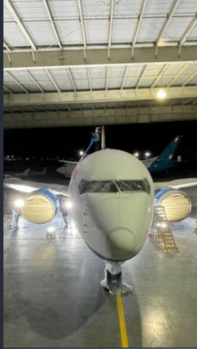
Scuff and Paint