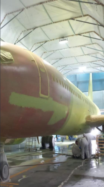
Pre paint program