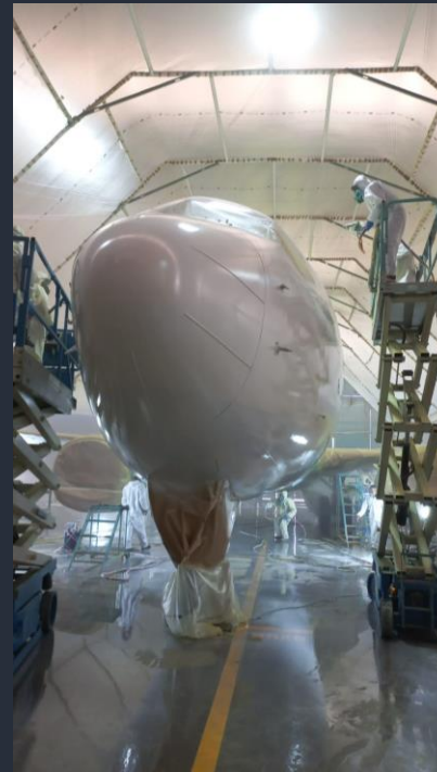
Strip and Paint